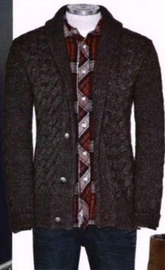
Cardigan Pringle of Scotland; camicia Arrow; jeans 7 for All Mankind