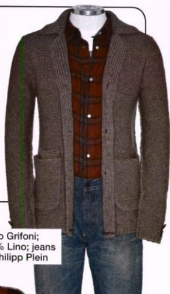
Giacca Mauro Grifoni; camicia 120% Lino; jeans Lee; t-shirt Philipp Plein

ony Music Studios, New York. L'anno è il 1993 e il set riproduce l'atmosfera funerea espressamente richiesta dalla band. Alla musica ci pensano i Nirvana, con un indimenticabile Kurt Cobain che registra l'unplugged di MTV di maggiore successo di tutti i tempi in jeans e t-shirt, preferendo un cardigan oversize al classico chiodo di pelle da rocker. Un look iconico del leggendario cantante a cui negli anni si sono ispirati numerosi designer. È proprio quello spirito rilassato, quasi disinteressato, del grunge a riaffermarsi con forza. Così per combattere il primo freddo ci sono morbidi cardigan di